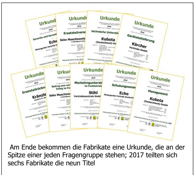
Am Ende bekommen die Fabrikate eine Urkunde, die an der Spitze einer jeden Fragengruppe stehen; 2017 teilten sich sechs Fabrikate die neun Titel

Die nächste Umfrage startet im Sommer 2017. Vielleicht gelingt es ja dann auch, Teilnehmer über Deutschland hinaus zu motivieren und dort eigene Länderauswertungen zu generieren.